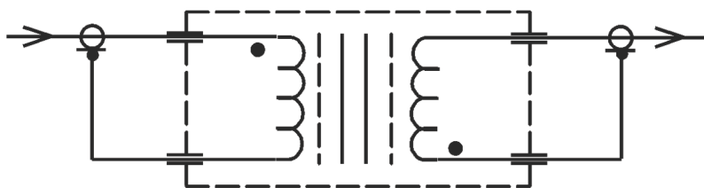
Рис.2 Схема электрическая принципиальная