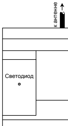
Рис. 1. Внешний вид приемника

Сертификаты соответствия: № РОСС RU.МЕ96.H00126; № С-RU.ПБ16.B.00194.